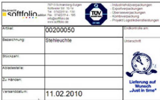
Beispiel für ein Arteketikett

Für das Auszeichnen von Waren setzen heutzutage viele Unternehmen noch immer eigenständige Inselfösungen ein, die nicht in das ERP-System integriert sind. Dieser Zustand verhindert einen durchgängigen Datenfluss, beinhaltet Fehlerquellen durch Redundanzen und erschwert die Transparenz. Mit dem Softfolio Zusatzmodul Etikettierung können Sie, direkt aus der Office Line, Artikel- und Adressetiketten verwalten und drucken. Dadurch entfällt die lästige und zeitaufwändige doppelte Eingabe der Artikeldaten. Darüber hinaus können Sie dieses Modul als Grundlage für die mobile Datenerfassung zum Ein- und Auslagern von Artikeln verwenden.